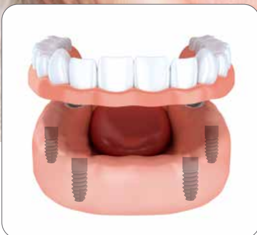
Implantatlösungen für den zahnlosen Ober- und Unterkiefer

Egal ob ein Unfall, Krankheit oder einfach nur Verschleiss: