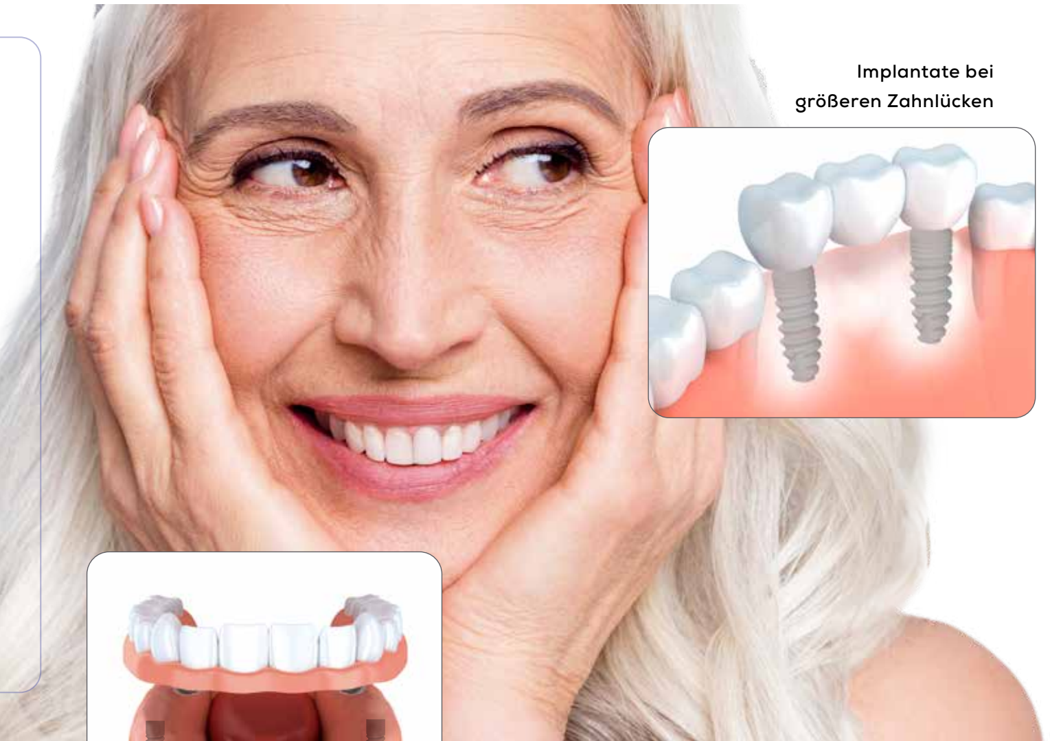
Implantate bei größeren Zahnlücken